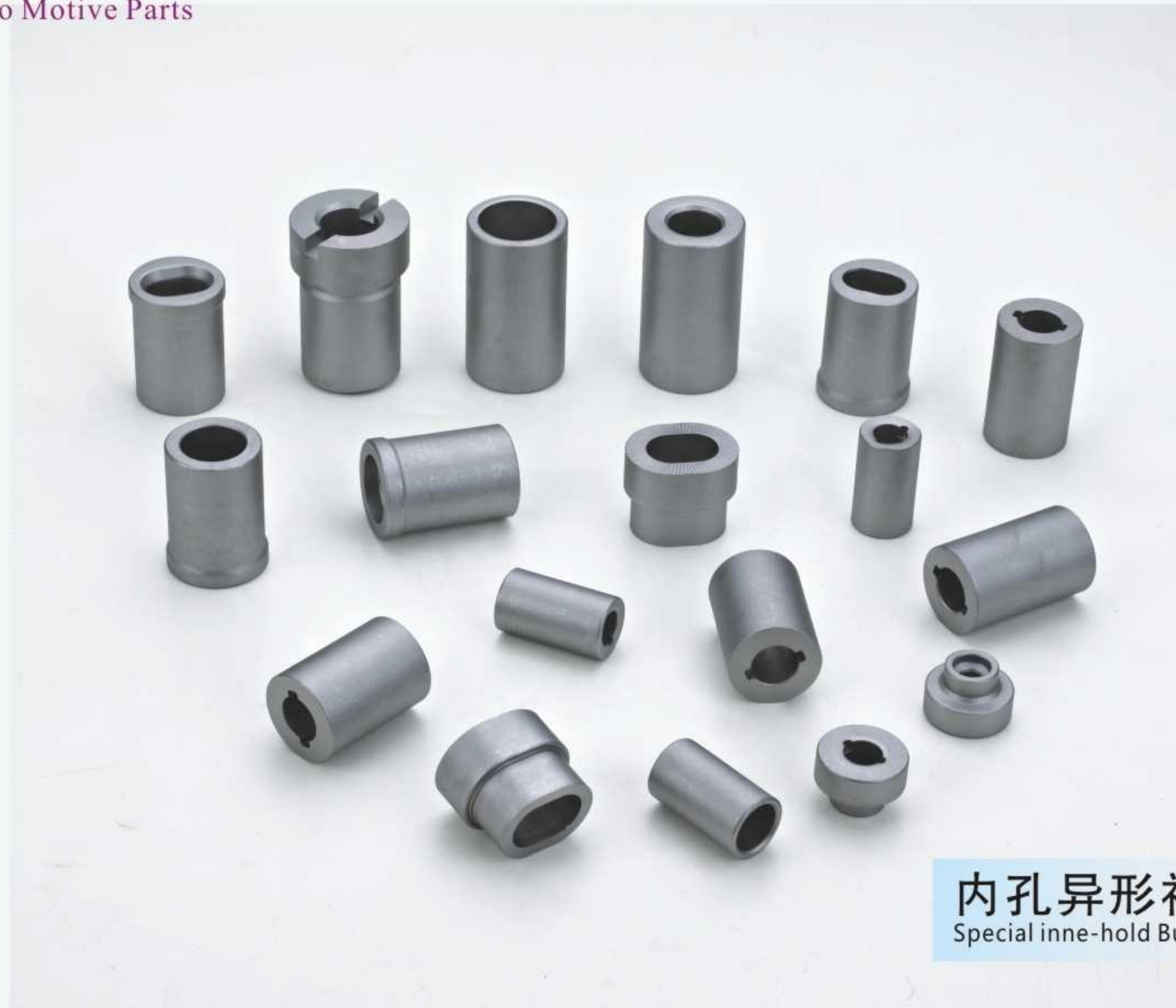
内孔异形衬套 Special inne-hold Bushings