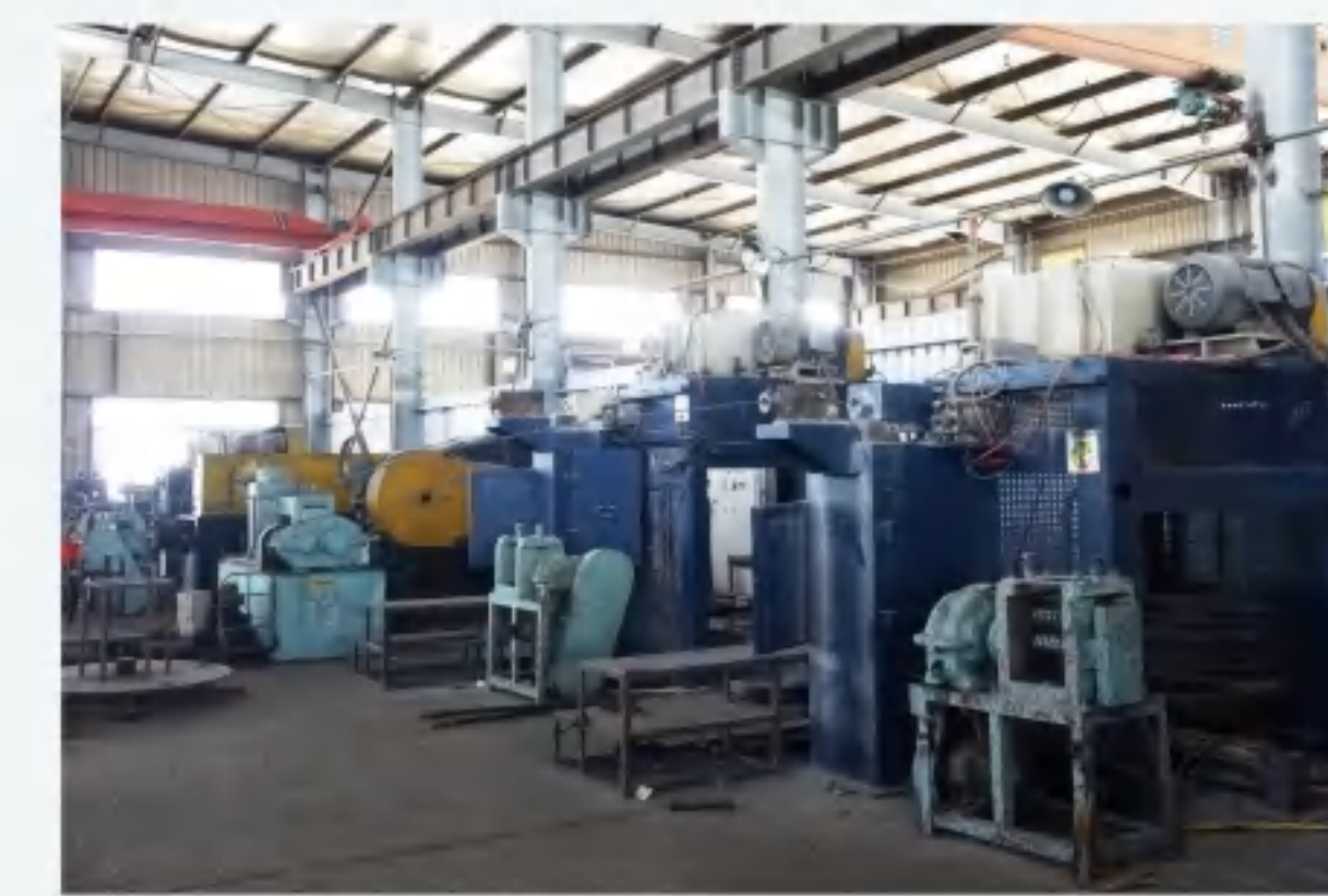
拉丝 Wire drawing