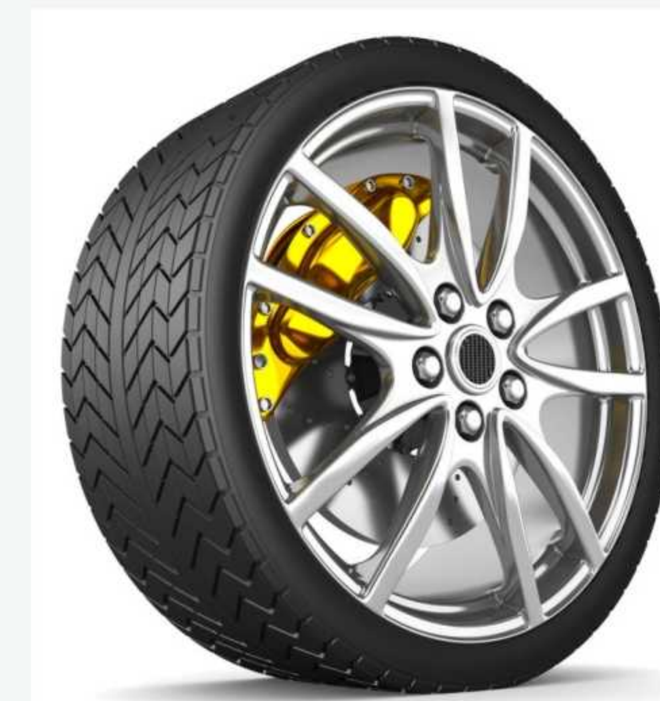
轮胎螺帽 Wheel nut