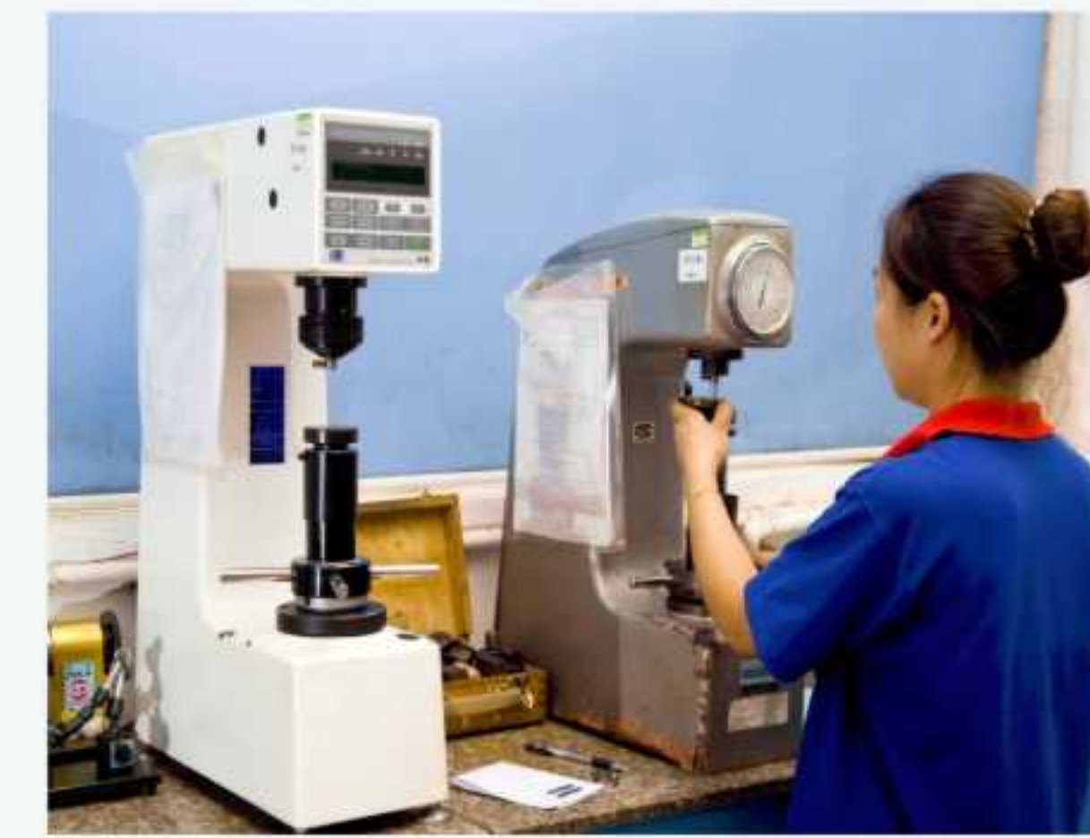
洛氏硬度机 Hardness Testing Machine