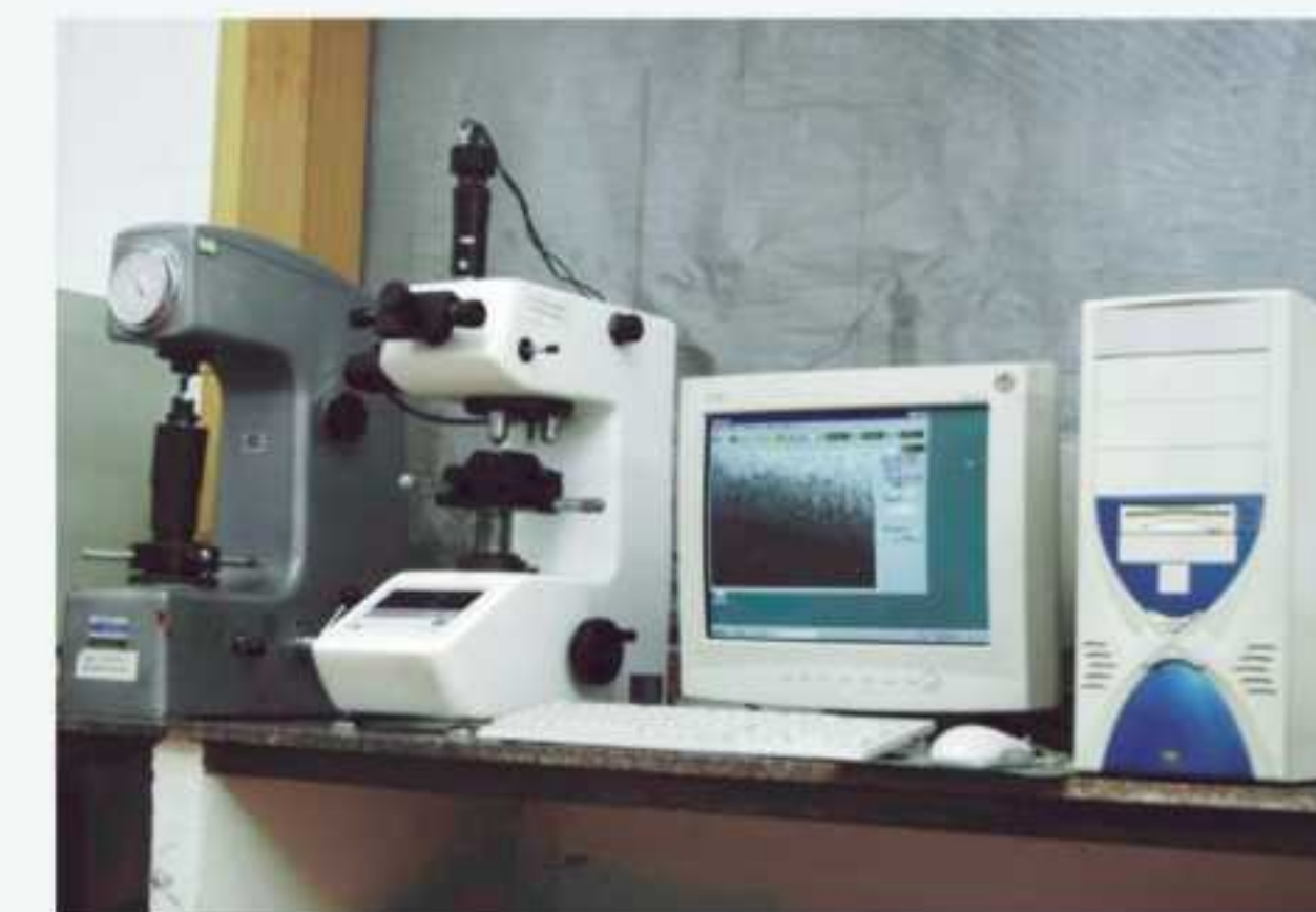
金相显微硬度机 Metallographic Microscope