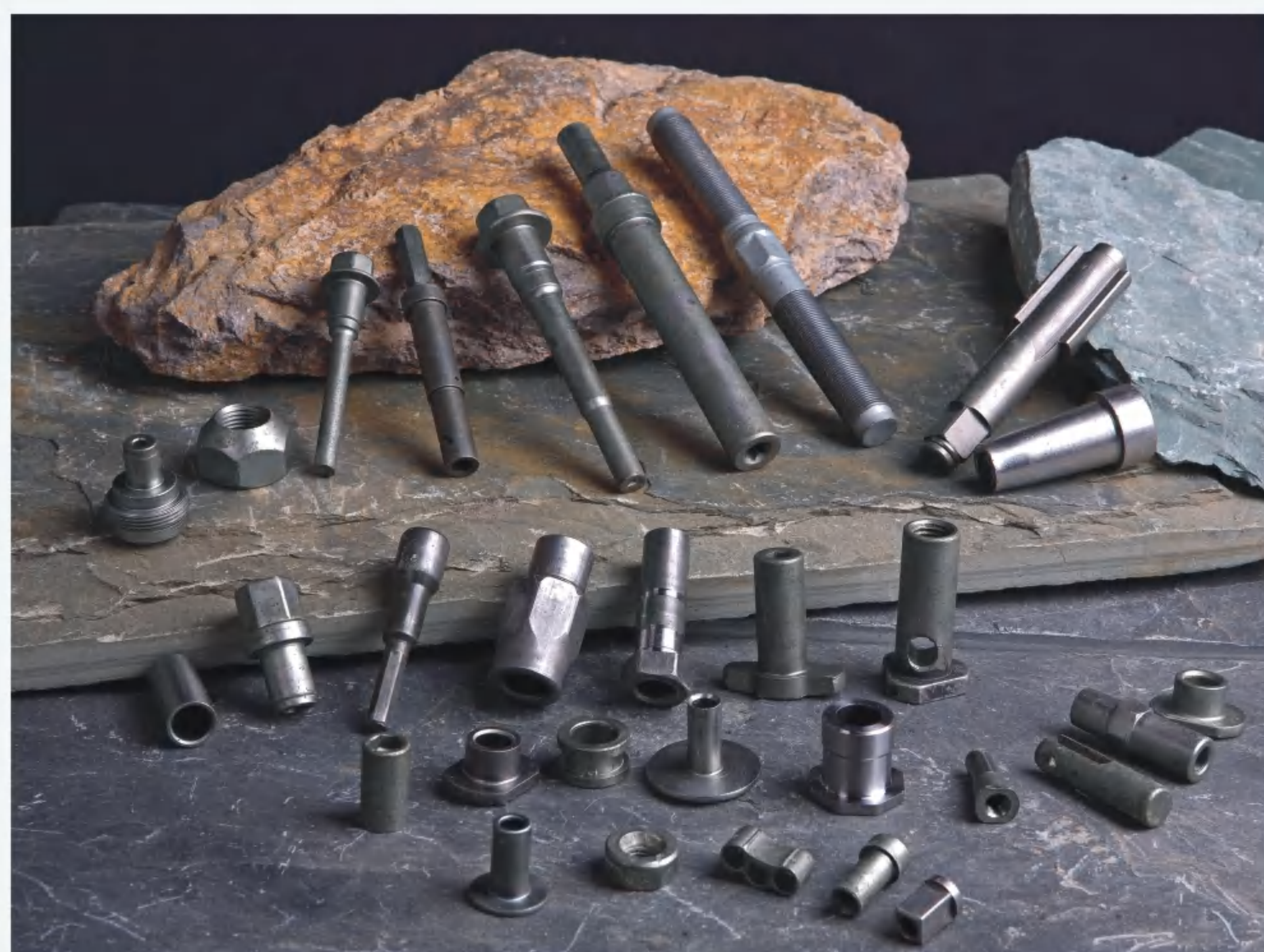
According to customer's drawing