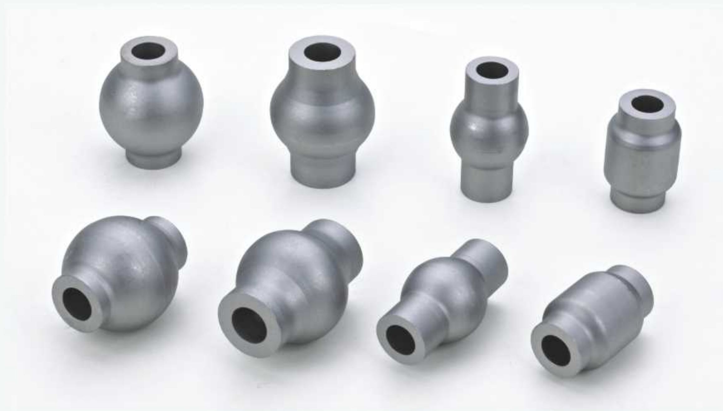
减震器葫芦衬套 Special Bushings for absorber