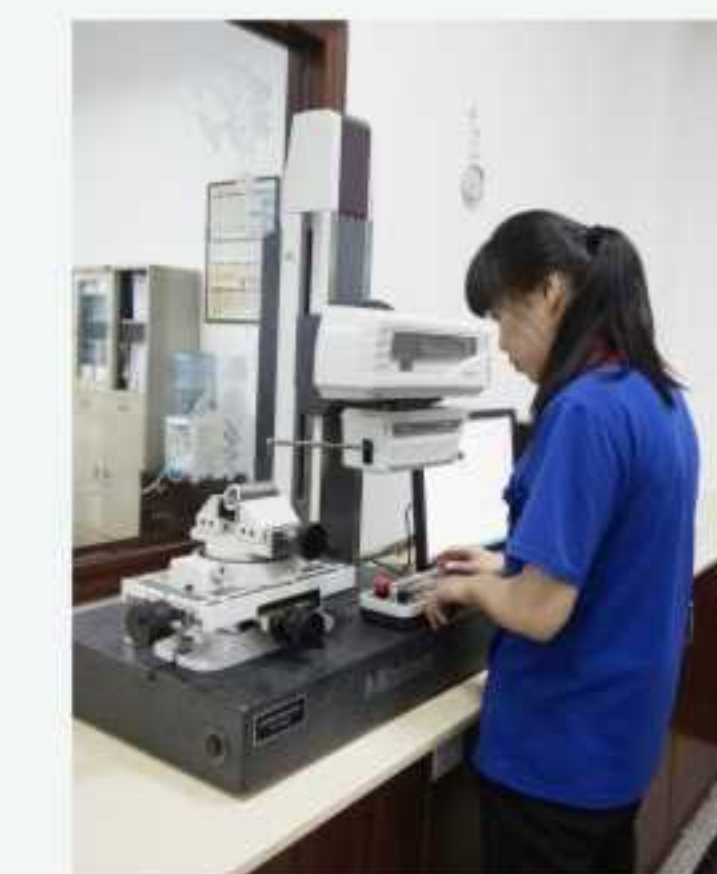
3D轮廓仪 3D profilometer