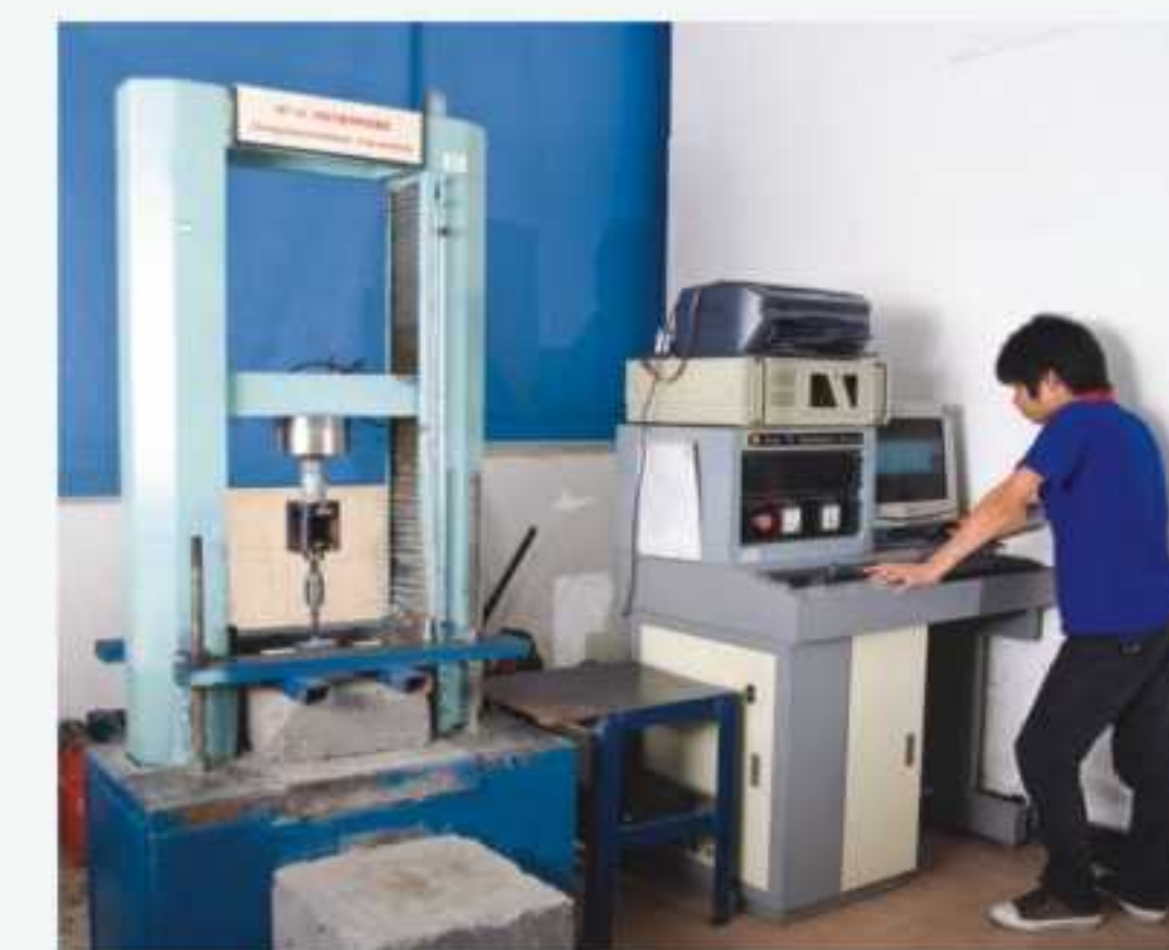
万能拉力试验机 Tensile testing machine