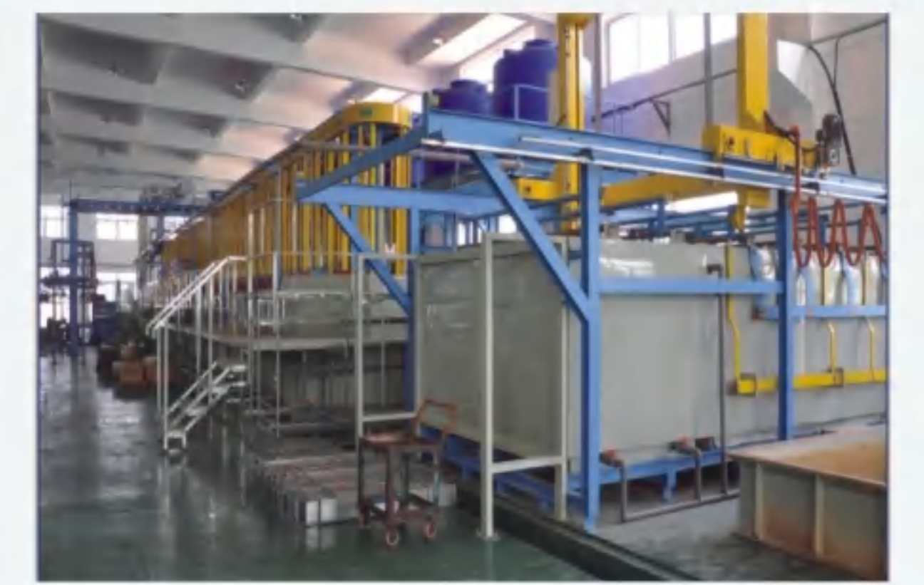
全自动吊挂式镀铬车间 Fully automatic hanging chrome plating workshop