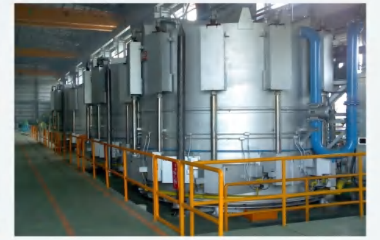
美国进口钟罩式球化退火炉 Bell bell type spheroidizing annealing furnace imported from USA