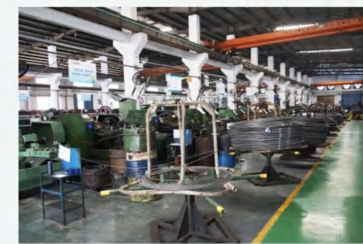
打头 Hit the head