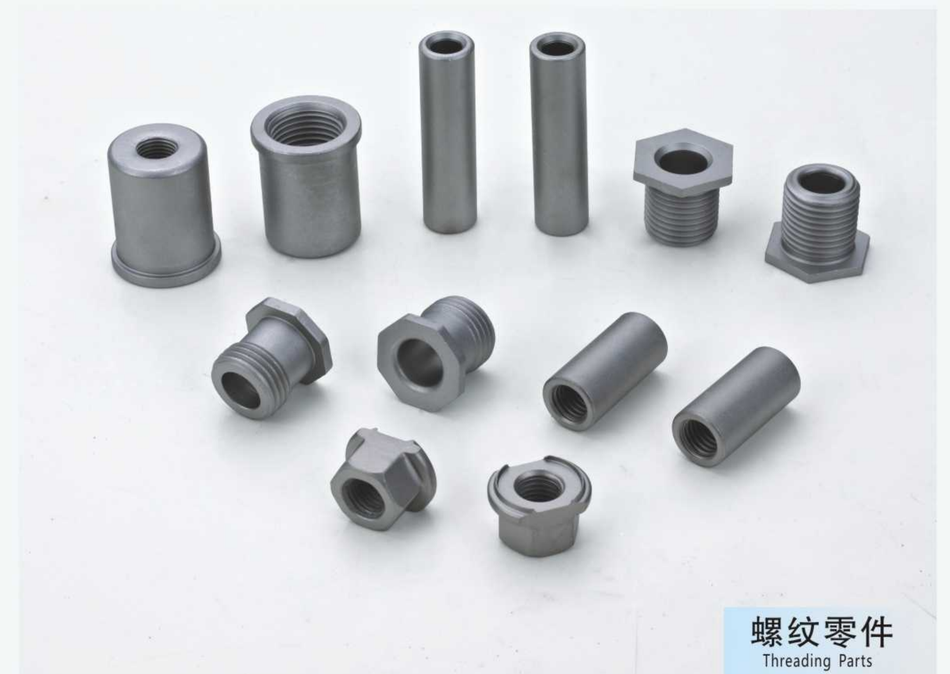
螺纹零件 Threading Parts