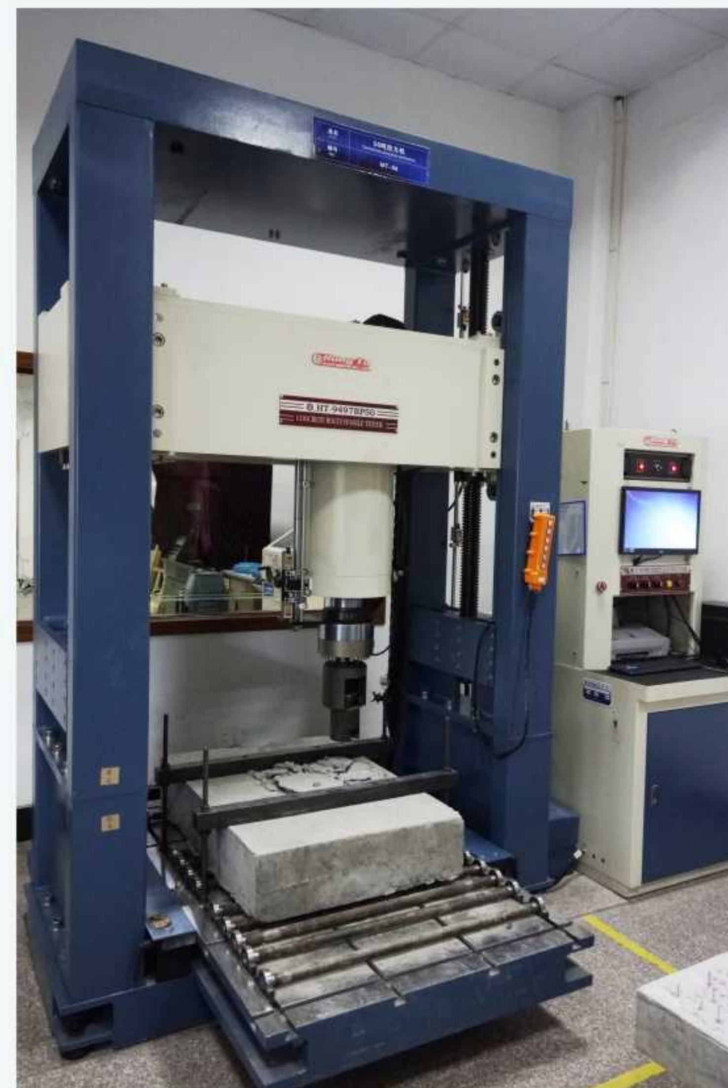
50吨拉力试验机 50 tons tensile testing machine