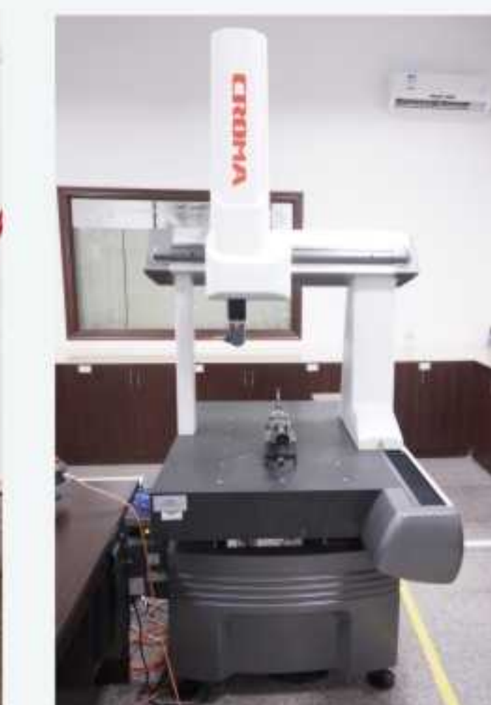
三坐标测量仪 Coordinates Measuring Machine