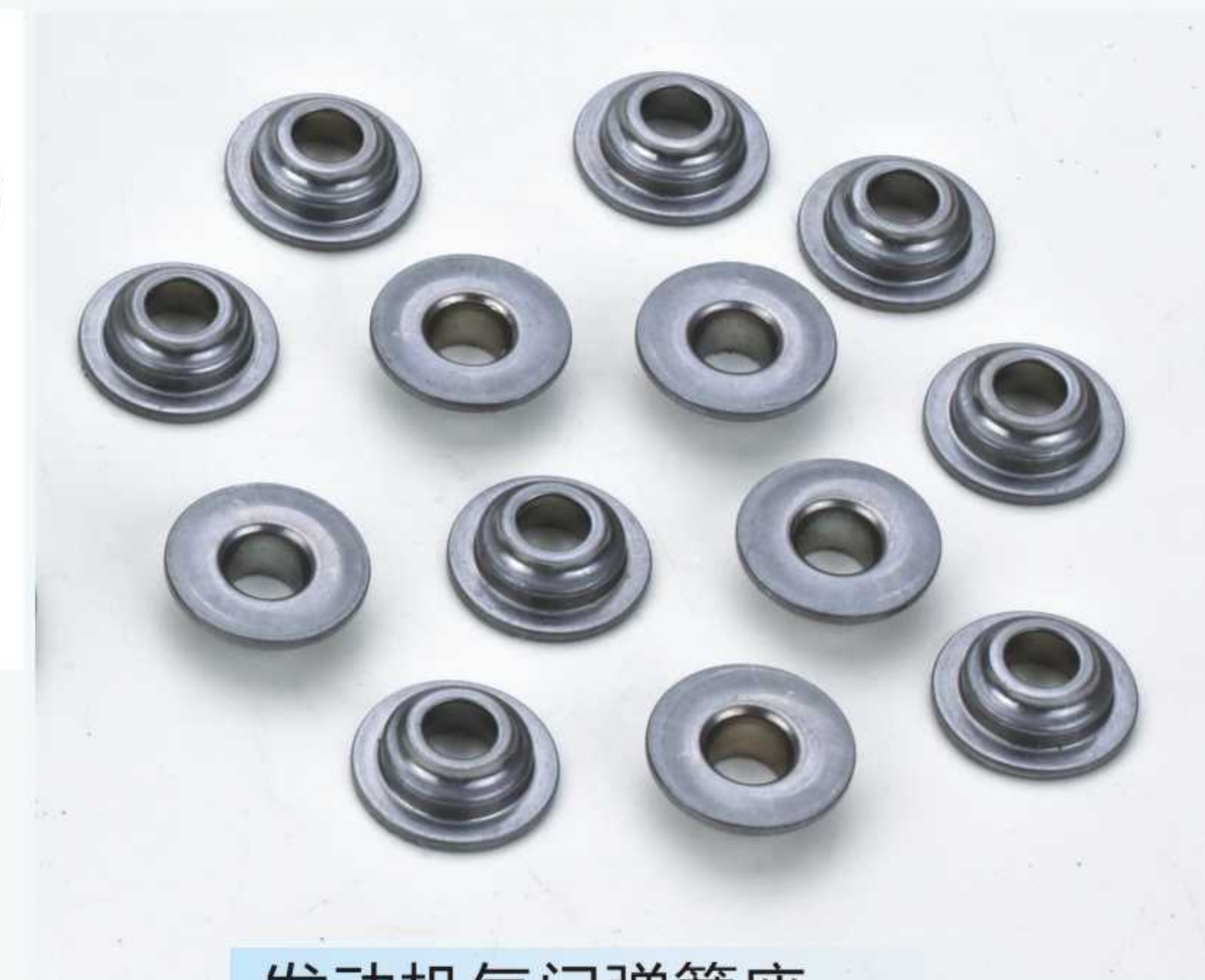
发动机气门弹簧座 Valve spring retainer