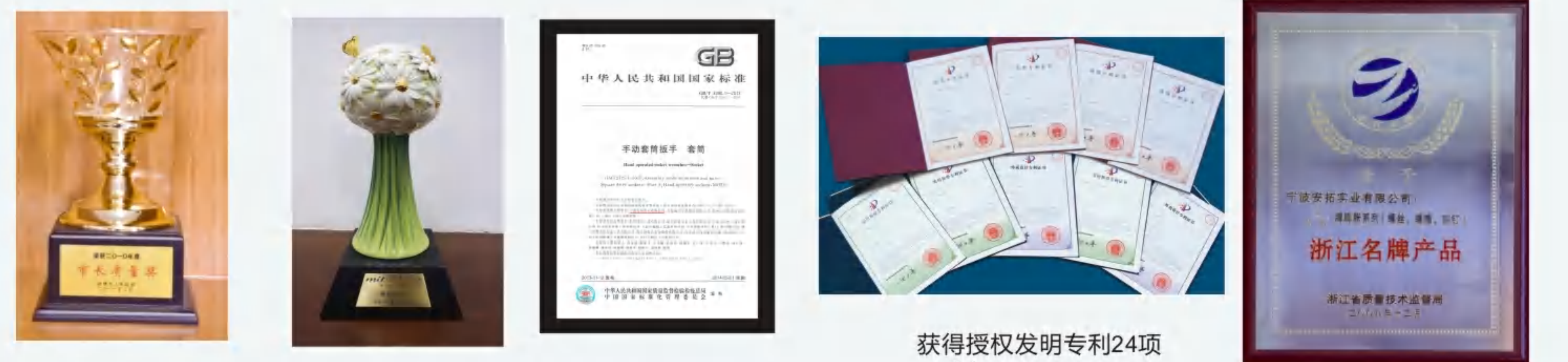
余姚市市长质量奖 Mayor quality award 第三届大陆杰出台商 Outstanding Taiwanese businessman in China 膨胀锚栓起草单位 Expansion bolt national standard drafted unit 获得授权发明专利24项 24 Patent Inventionsz