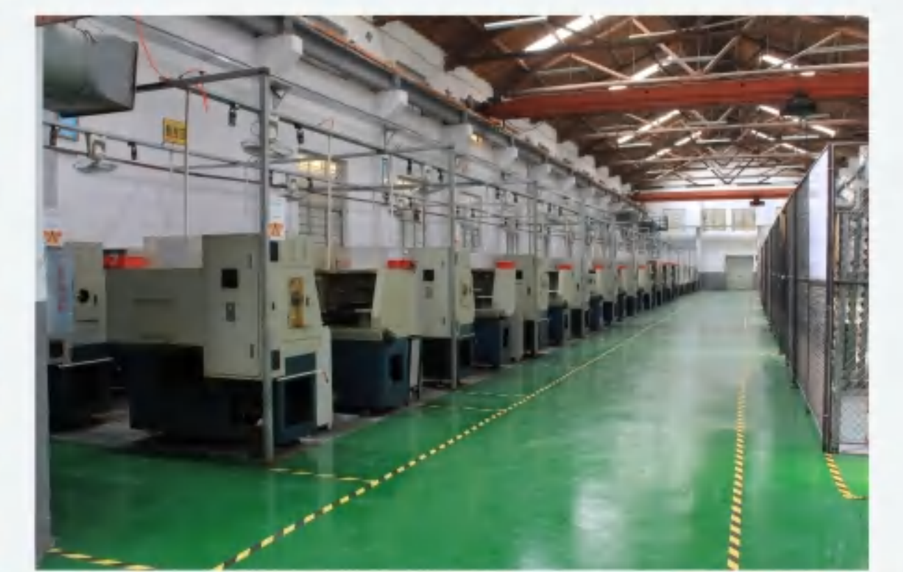
CNC数控 CNC numerical control