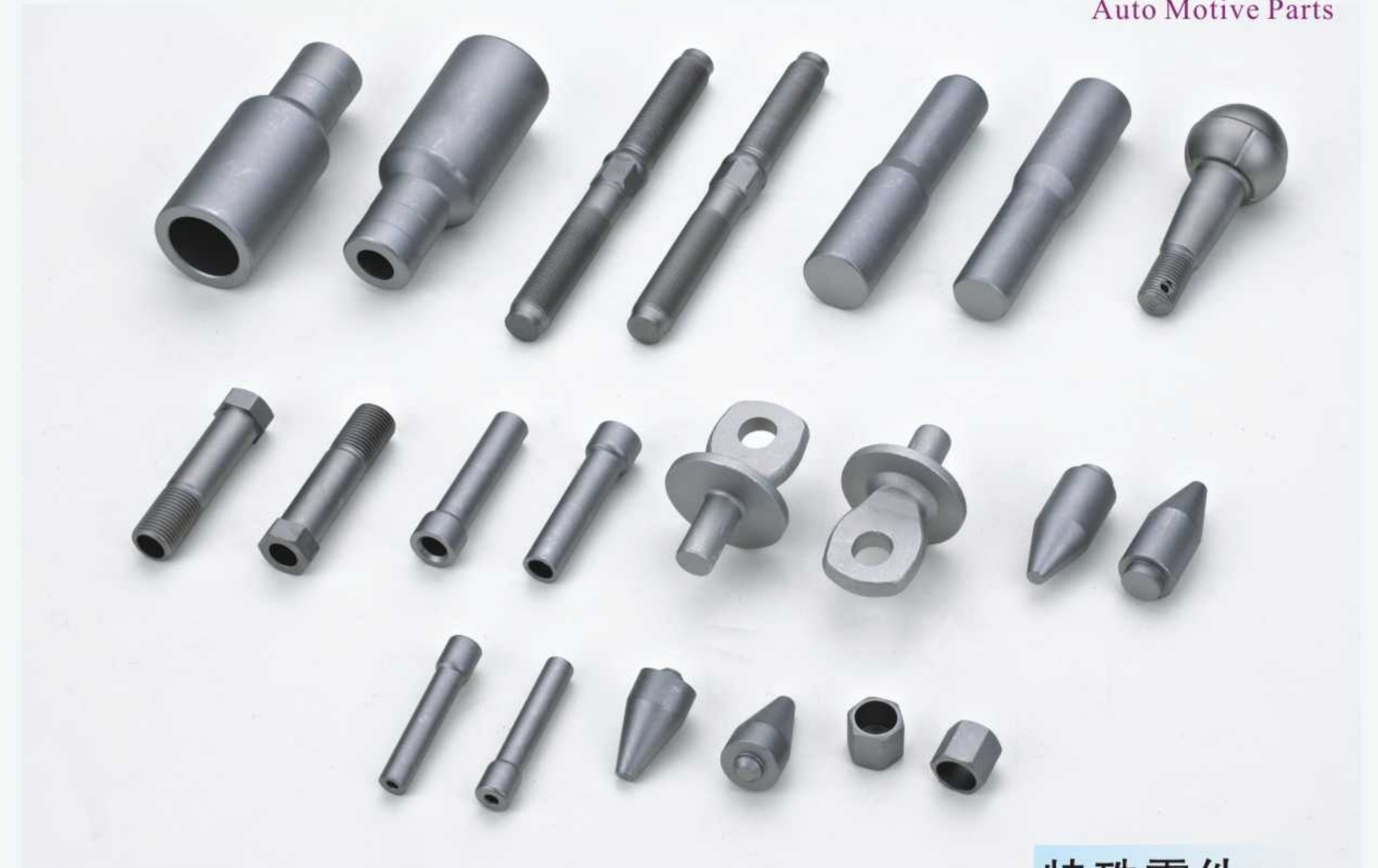
特殊零件 Special Parts