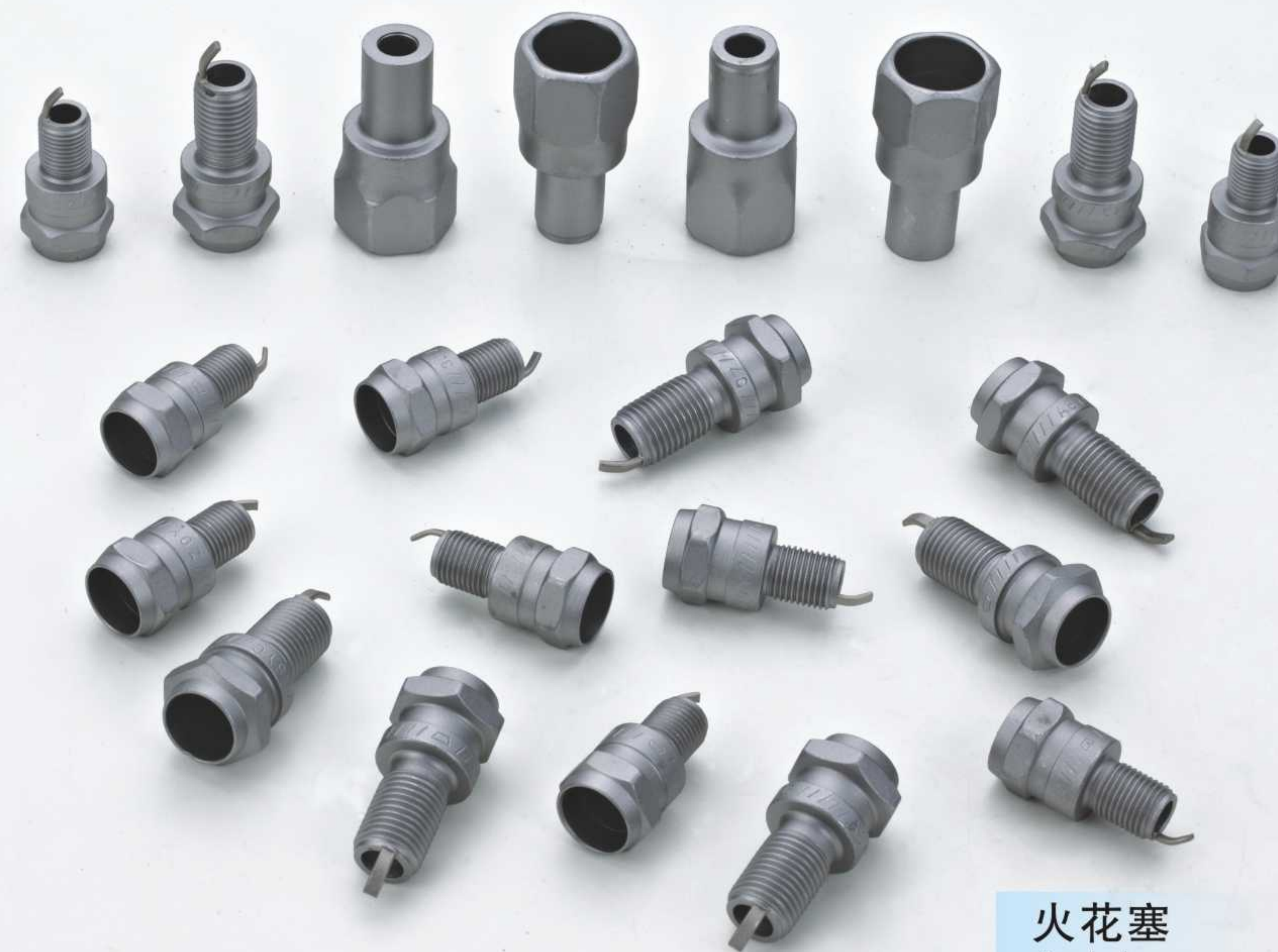
火花塞 Spark plugs