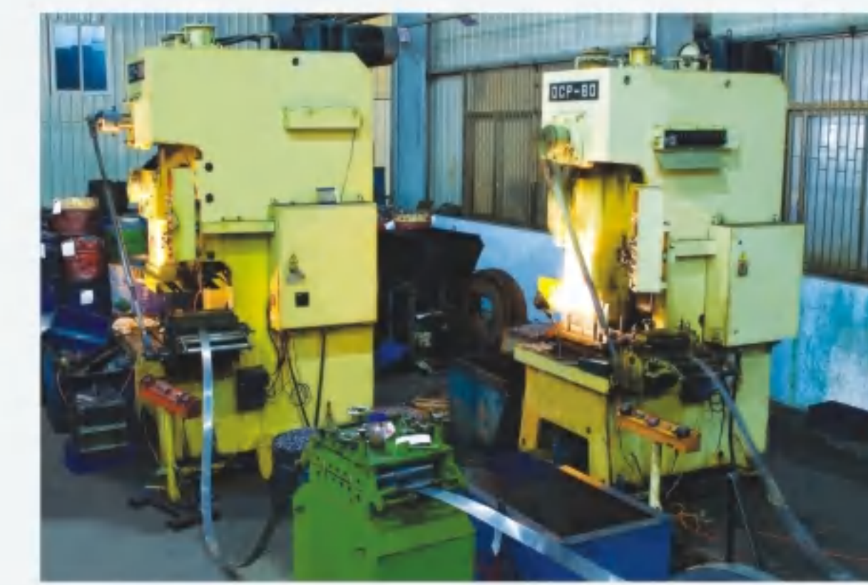
多工位冲床 Multi station punch press