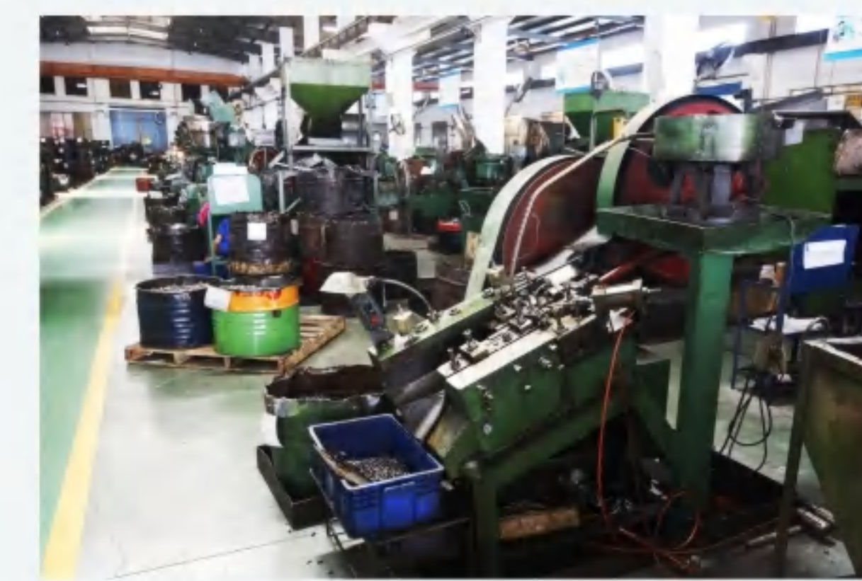
辗牙 Grinding teeth