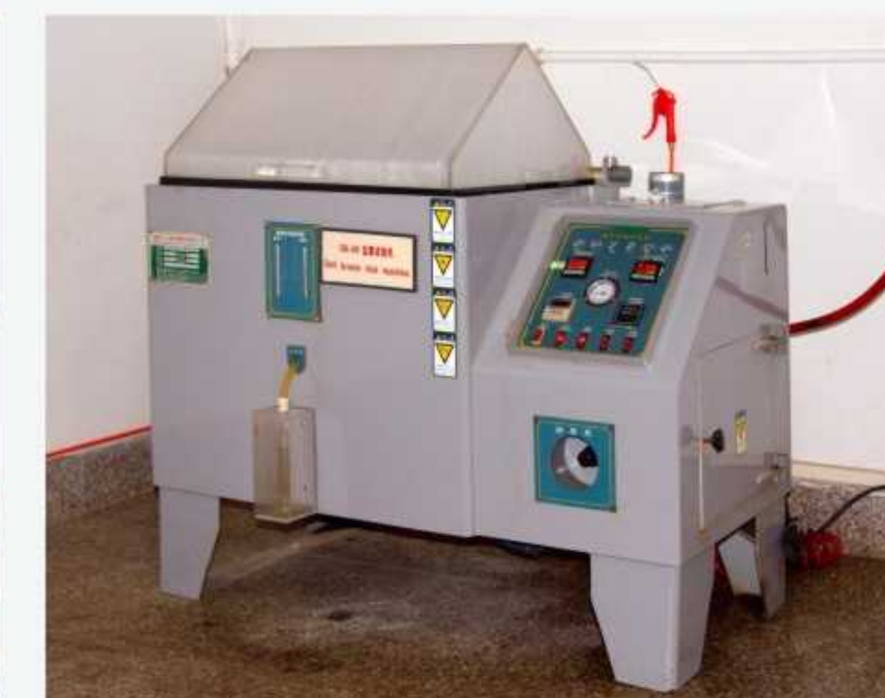
盐雾试验机 Neutral salt spray Testing Machine