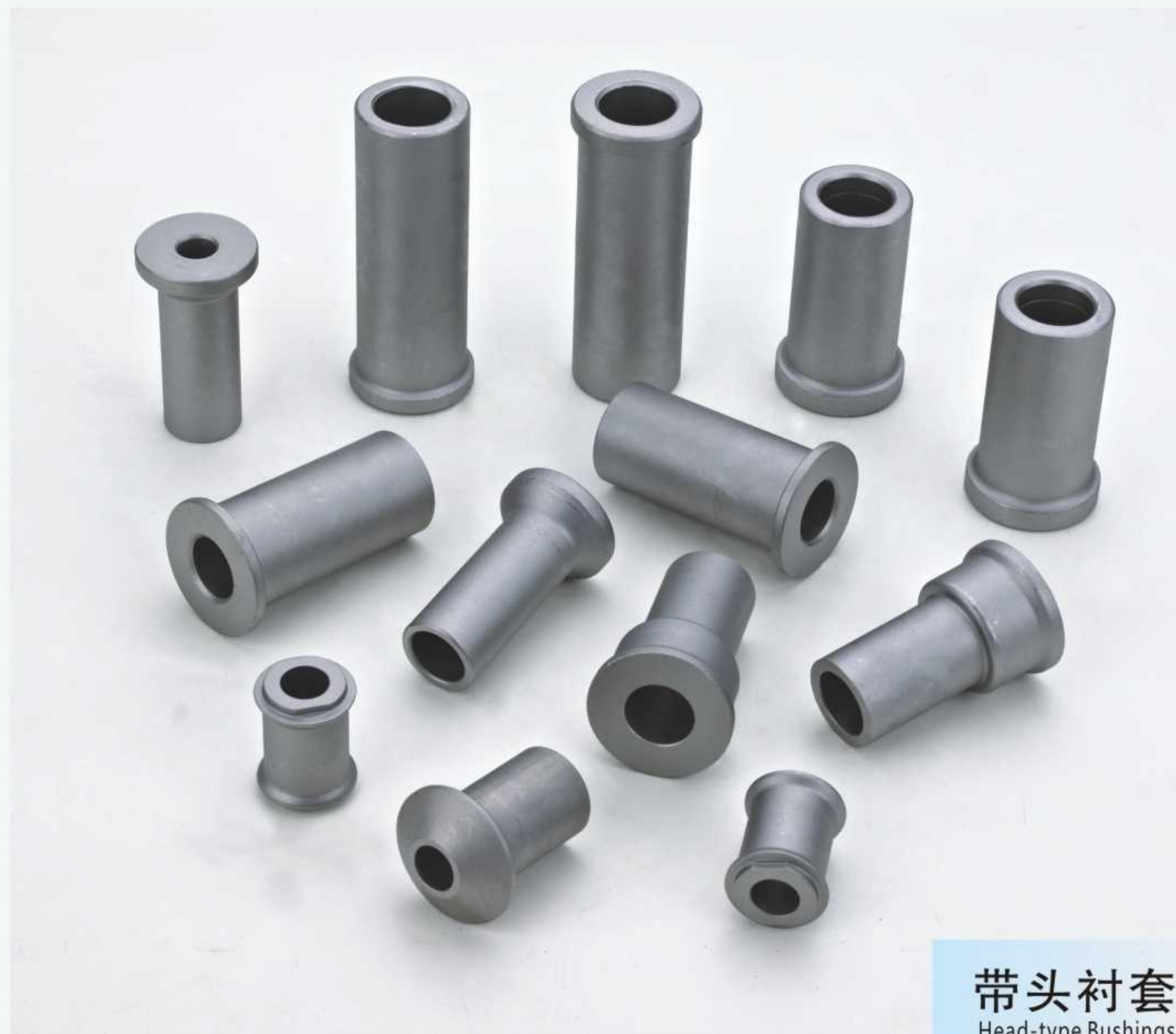
带头衬套 Head-type Bushings