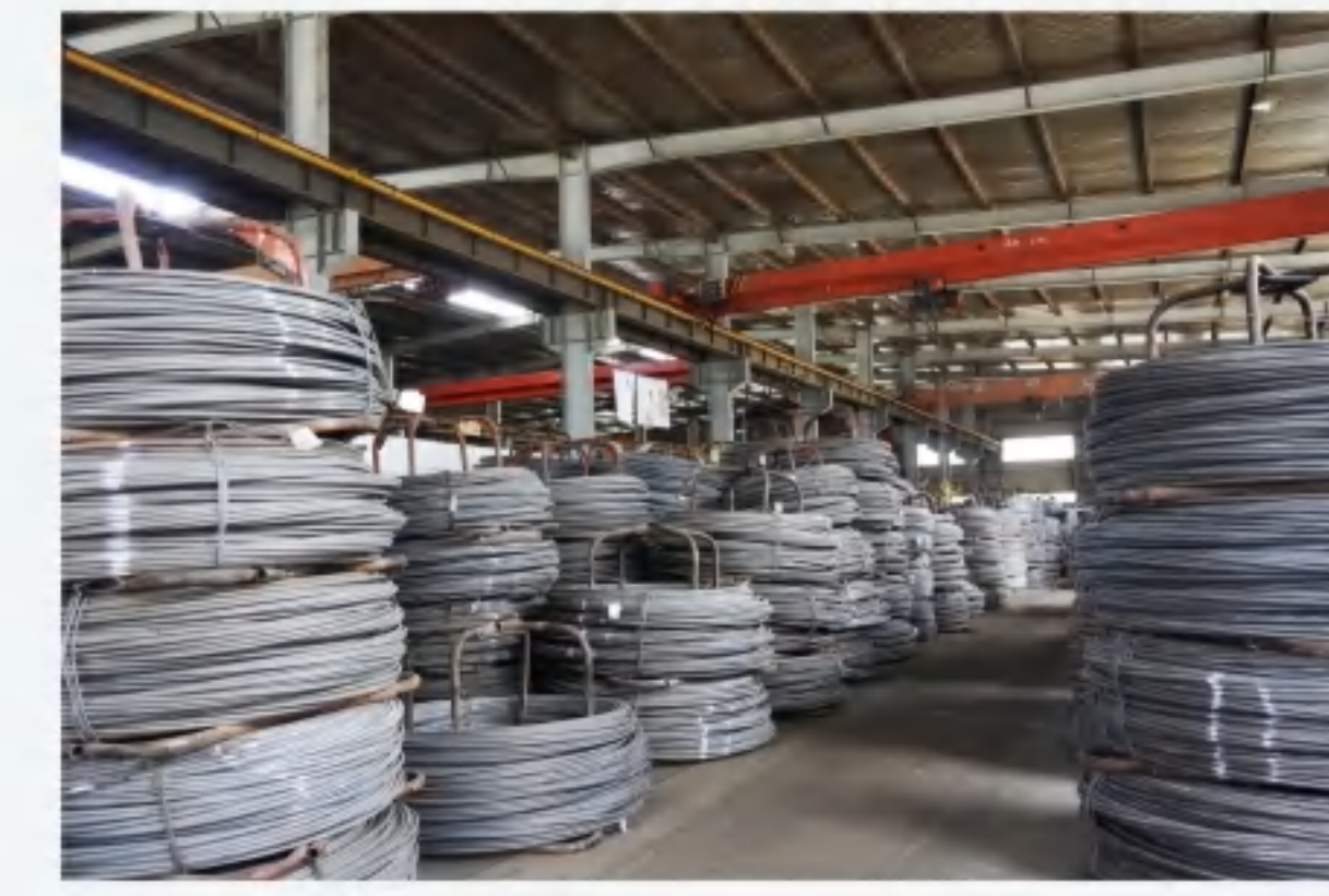
原材料 Raw material