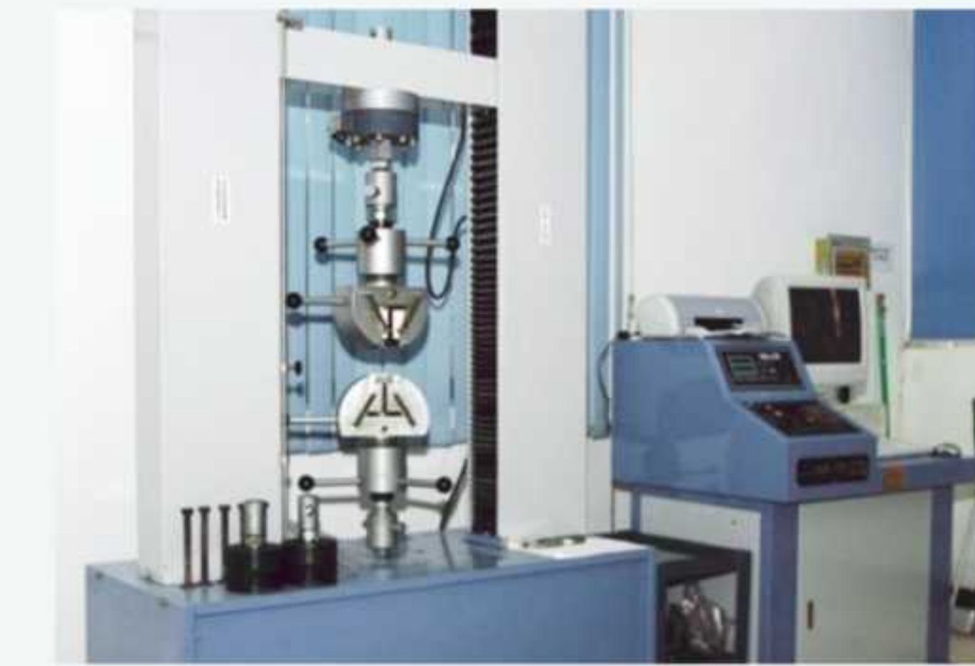
电脑式万能材料试验机 Universal material testing machine for computer room