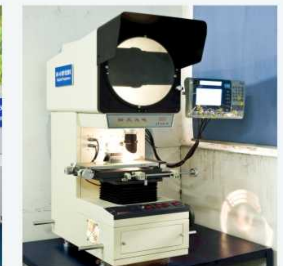
数字式投影仪 Digital projector