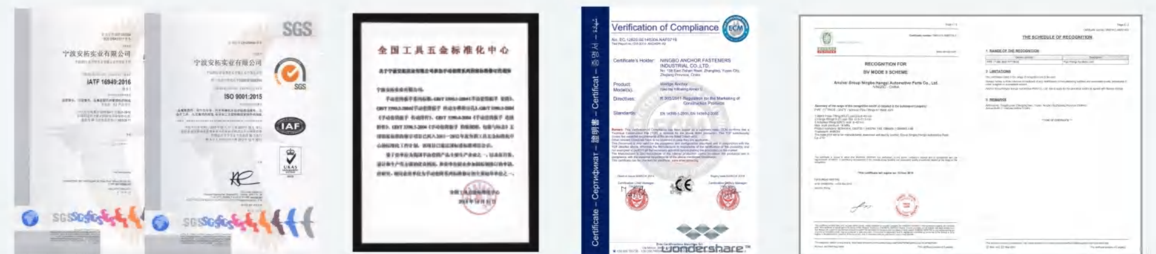
安拓IATF 16949|Anchor ISO9001证书 Anchor IATF 16949|Anchor ISO9001 certification 套筒国际起草单位 Socket national standard drafted unit CE认证证书 CE Certification drafted unit 船舶认证证书 BV Mode II Scheme