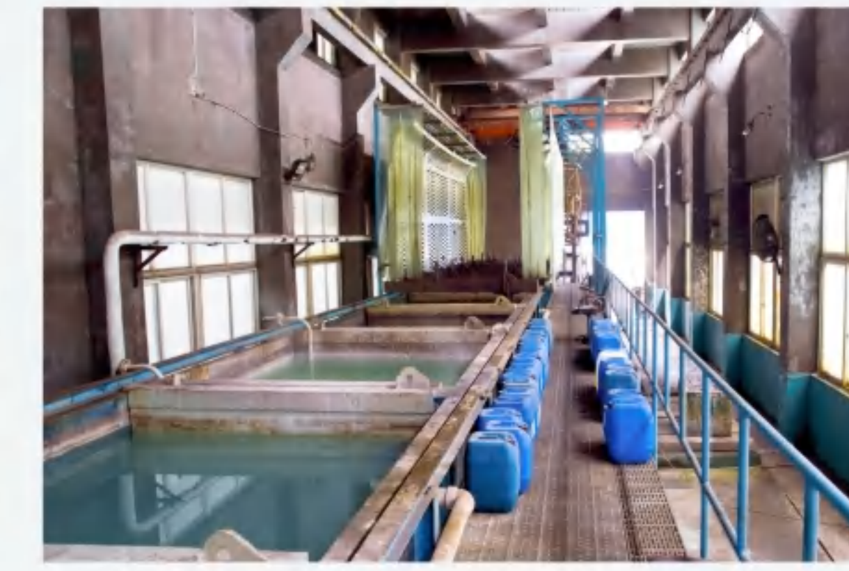
线材磷化 Phosphating of wire rod