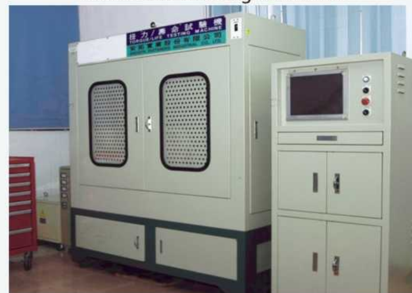
电脑式万能扭力测试机 Toqure Testing Machine