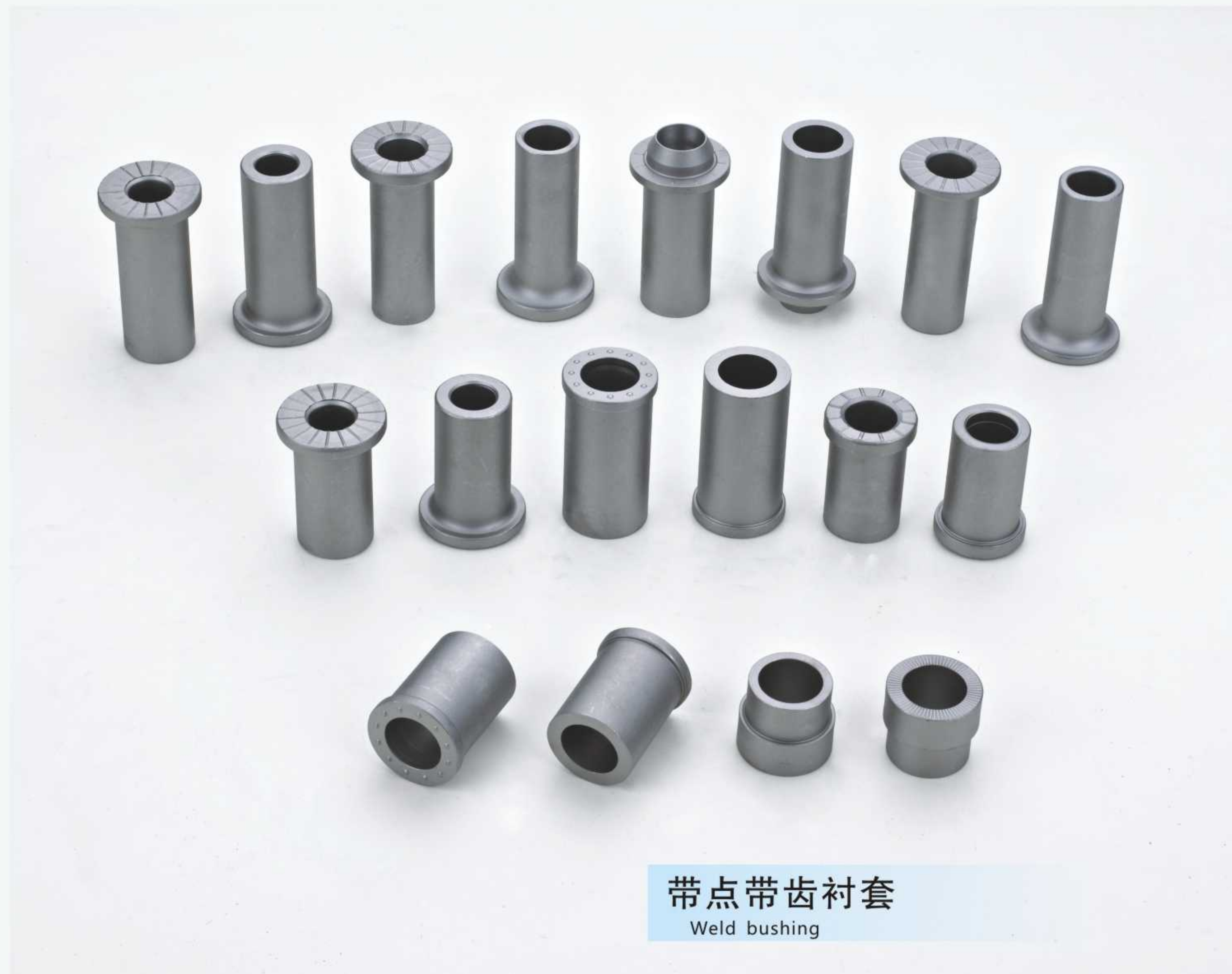
带点带齿衬套 Weld bushing